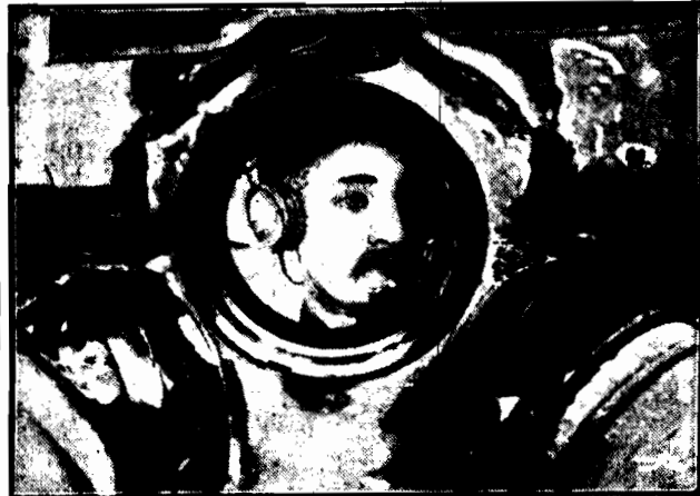
Popularność radja sięga nawet na dno morza, dokąd schodził ono w kostjumie nurka, słuchającego go się dzieje na świecie.