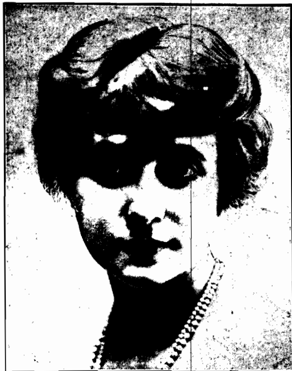
KLAUDYNA FRANCE tancerka Folies Berger i gwiazda filmowa.