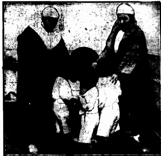
Zwyciężony wódz marokański z dziećmi swymi na statku francuskim, który odwiezie na Madagaskar.