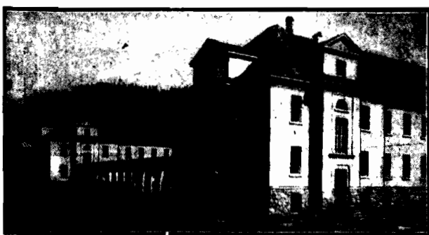
otwarte w dniu 14 b. m.